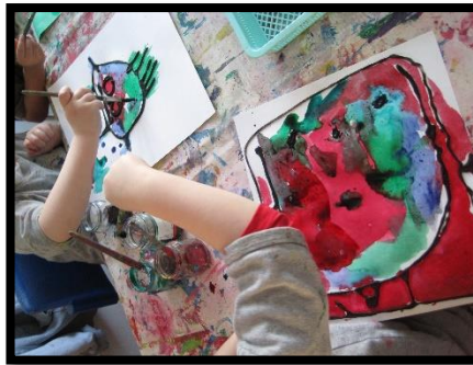
Sandur, blek, sjálfsmyndir