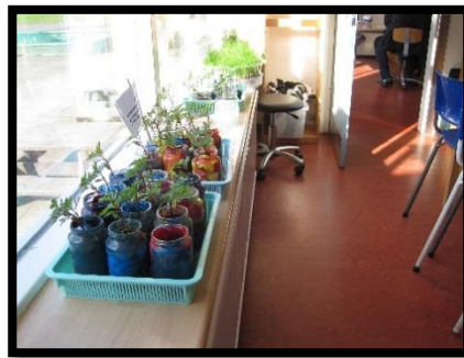
Umhverfisvika – vorverkin.