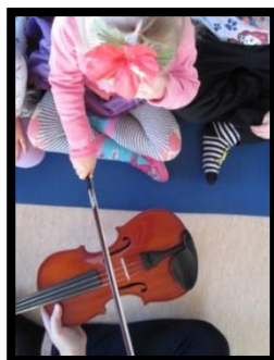
Innlifun - upplifun úti og inni !