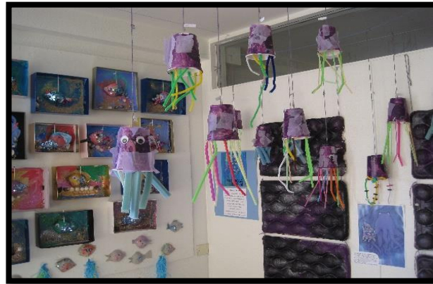
Regnbogafiskurinn er bók sem við vinnum mikið með í endurvinnslu/sköpun

Sérkennsla fékk úthlutað fleiri tímum (fleiri verkefni) yfir veturinn sem kallaði á fleira fólk. Nú hefur bærinn boðið fleiri undirbúningstíma fyrir deildir sem er gott, en það kallar einnig á hærri starfsmanna-prósentur /fleira fólk.