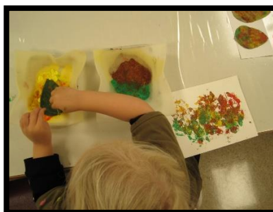
Upplifun í ýmsu formi